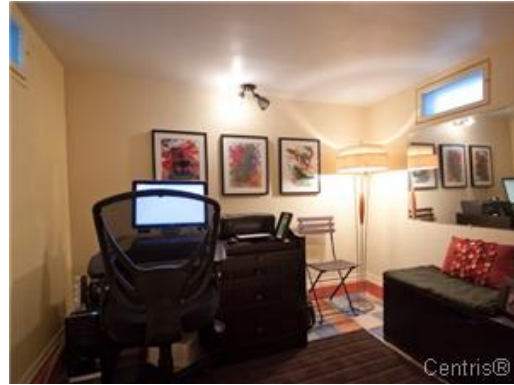
Bureau à domicile